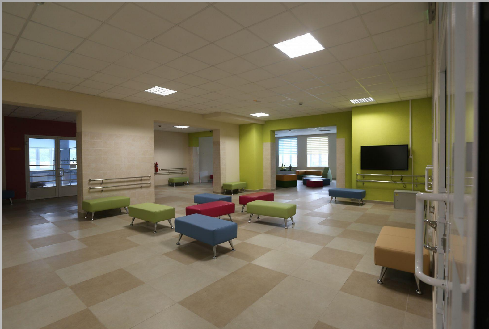
Предложение по мебелировке в холле