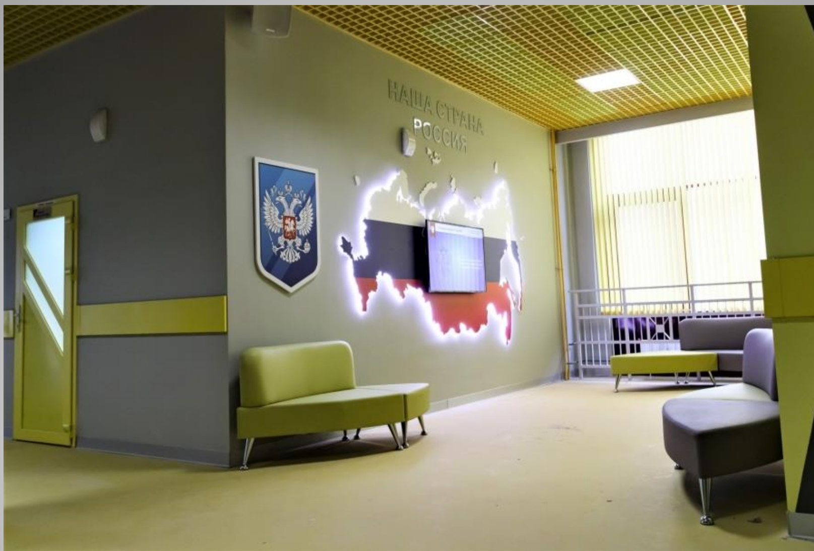
Карта Российской Федерации